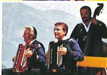
上/ヨーデル 下/民族音楽