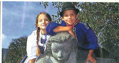
左/ハイジの物語のころの生活の様子を伝える「ハイジの家」内部 右/地元の子どもの活動による募金で作られた「ハイジの泉」