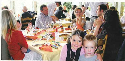
町を見下ろす高台にあるレストランで思い出に残る休日