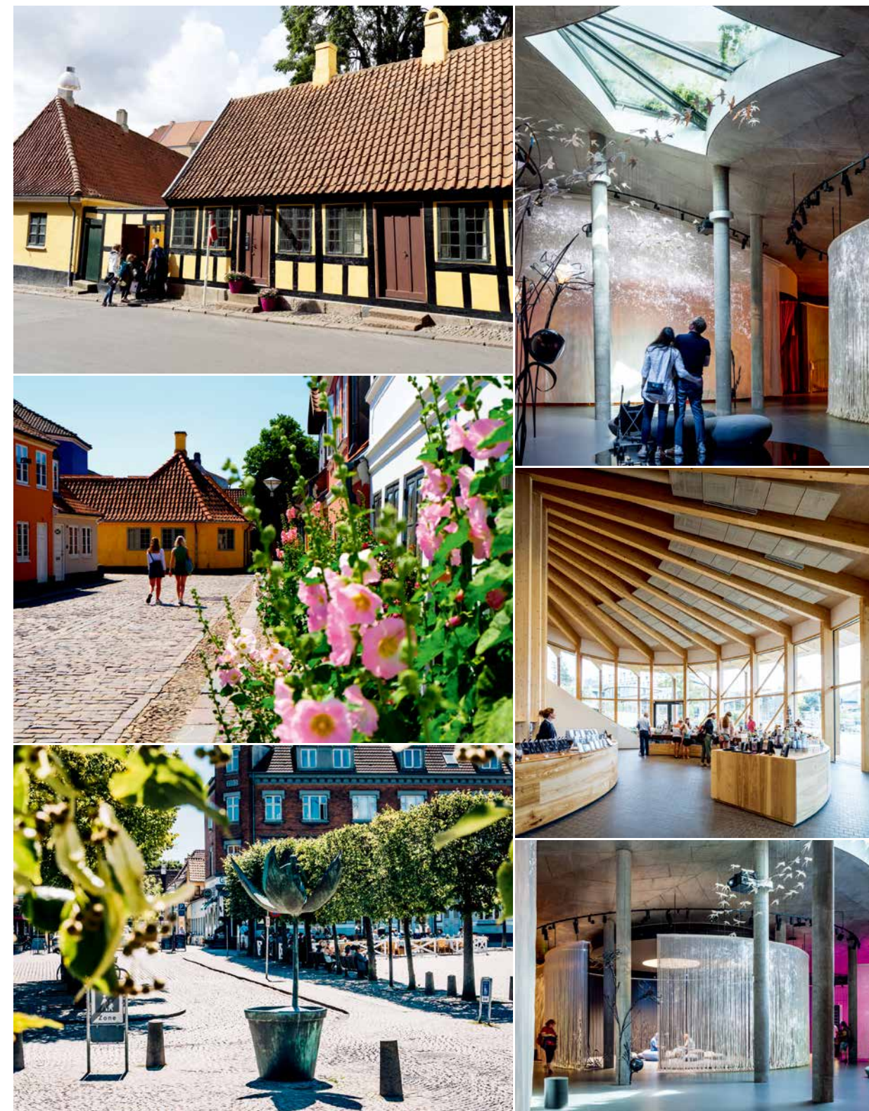
左上：從狹小陳舊的安徒生兒時居所，可想見當時生活貧困的情景。 左中：安徒生博物館裡開放遊客參觀安徒生出生房間。 左下：街道陳列著《姆指姑娘》故事主題的裝置藝術。 右上：安徒生博物館透過互動裝置帶領遊客進入作者筆下的童話世界。 右中：結合木頭、竹子妝點的安徒生博物館，是由日本知名建築師隈研吾操刀設計。 右下：安徒生博物館以現代科技重新打造館內設施。

至於又名童話花園的安徒生公園，可觀賞到隨四季變化的花卉，洋溢著濃濃的童話氣息。花園裡矗立著安徒生雕像，河中還有展示《小錫兵》（The Steadfast Tin Soldier）的摺紙船裝置藝術，就如故事描述摺紙船載著小錫兵前進，儘管倍嘗艱難險阻，最後仍帶著他回到心愛之人身旁，這艘停泊在河上的摺紙船彷彿也在等待造夢者，一同航向心中的目的地。