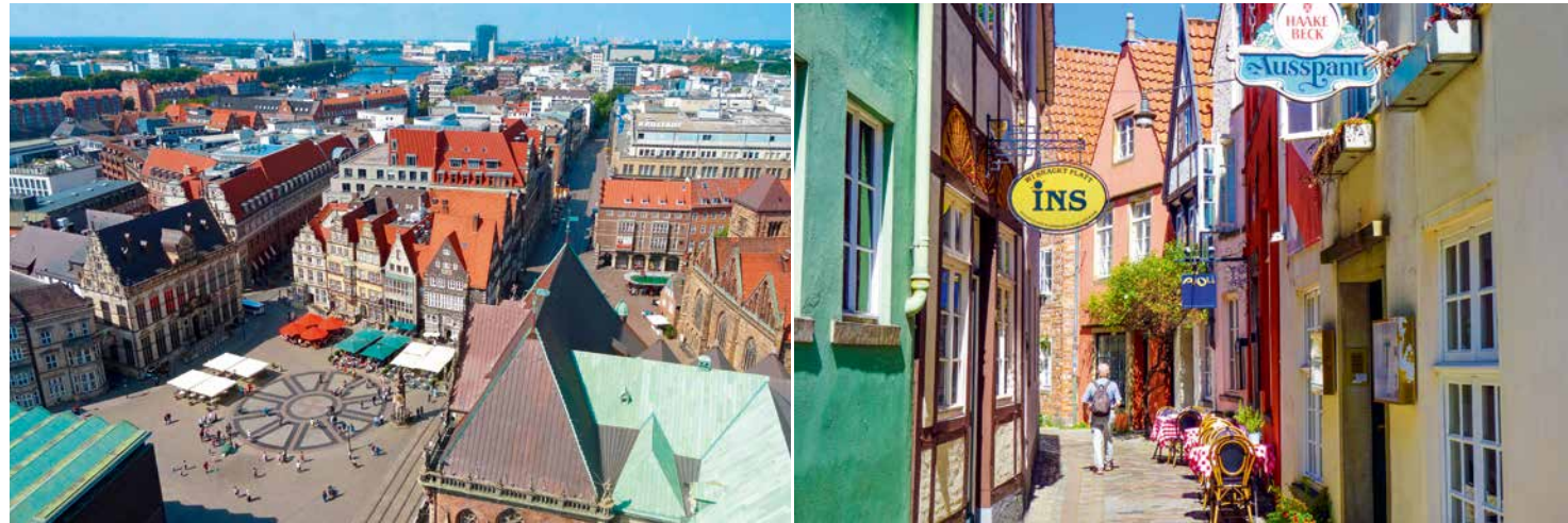
左圖：市場廣場是遊客造訪不來梅的最佳起點。©Ingrid Krause/BTZ Bremer Touristik-Zentrale 右圖：不來梅舊城區仍保留著濃厚的中古時期風情。©Ingrid Krause/BTZ Bremer Touristik-Zentrale

在德國，隨著格林兄弟生活、工作的足跡與筆下故事的發生地點，從出生地哈瑙（Hanau）直到終點不來梅（Bremen），即可串連成一條綿延600公里的童話之路，予人無限的夢幻與詩意。