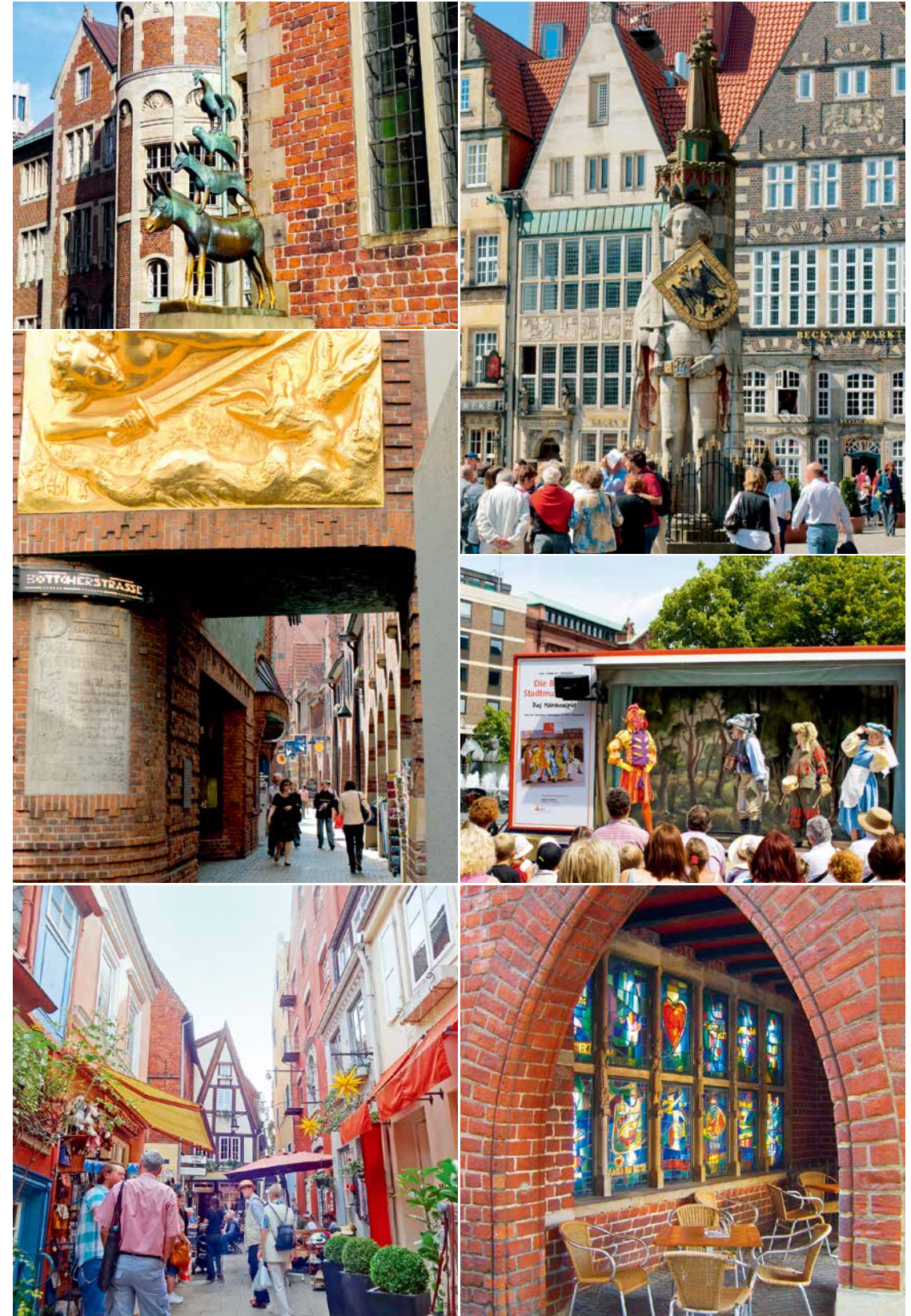
左上：著名的雞、貓、狗、驢雕像就矗立在市場廣場上。©BTZ Bremer Touristik-Zentrale 左中：貝特赫街入口的黃金浮雕相當引人注目。©Manuela Gangl/BTZ Bremer Touristik-Zentrale 左下：以哈瑙為起點的德國童話之路，一路綿延至終點不來梅。©Ingrid Krause/BTZ Bremer Touristik-Zentrale 右上：羅蘭雕像已經列入世界文化遺產。©BTZ Bremer Touristik-Zentrale 右中：城內不時舉辦《不來梅樂隊》的表演，總會吸引遊客聚集觀看。©BTZ Bremer Touristik-Zentrale 右下：貝特赫街以藝術妝點的街景，是旅程中迷人的視覺焦點。©Silke Krause/BTZ Bremer Touristik-Zentrale

另一處如童話場景的街道「貝特赫街」（Böttcherstrasse），是由一位咖啡富商斥資改建，成為將中世紀建築融入新藝術及裝飾藝術的文化街區。入口處抬頭便能欣賞到黃金浮雕，走入街道隨即感受到獨特的氛圍，其中像是架設在屋頂上方的著名麥森瓷器（Meissen）鐘琴，每到固定時間啟動演奏，整條貝特赫街就洋溢著令人沉醉的美妙樂音。每年5月到9月的週日，在市中心Domshof廣場還有《不來梅樂隊》現場演出，同樣為城市注入了熱鬧的童話氣息。