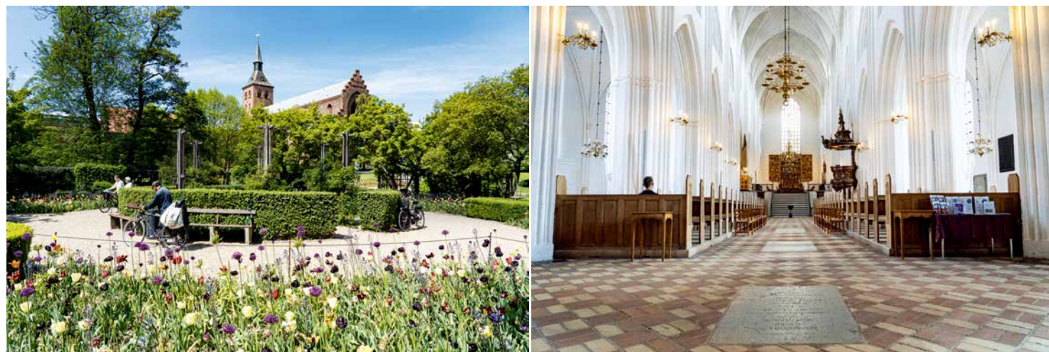
左圖：在安徒生的故鄉奧登塞保留許多與他兒時生活相關的點滴。 右圖：哥德式風格的奧登塞大教堂予人莊嚴肅穆之感。

出生於奧登塞（Odense）的著名童話作家安徒生，從小家境清貧，父親原本是鞋匠，從軍歸來後不久便驟逝，當時安徒生年僅11歲，因此全靠母親幫忙洗衣服維持家計。