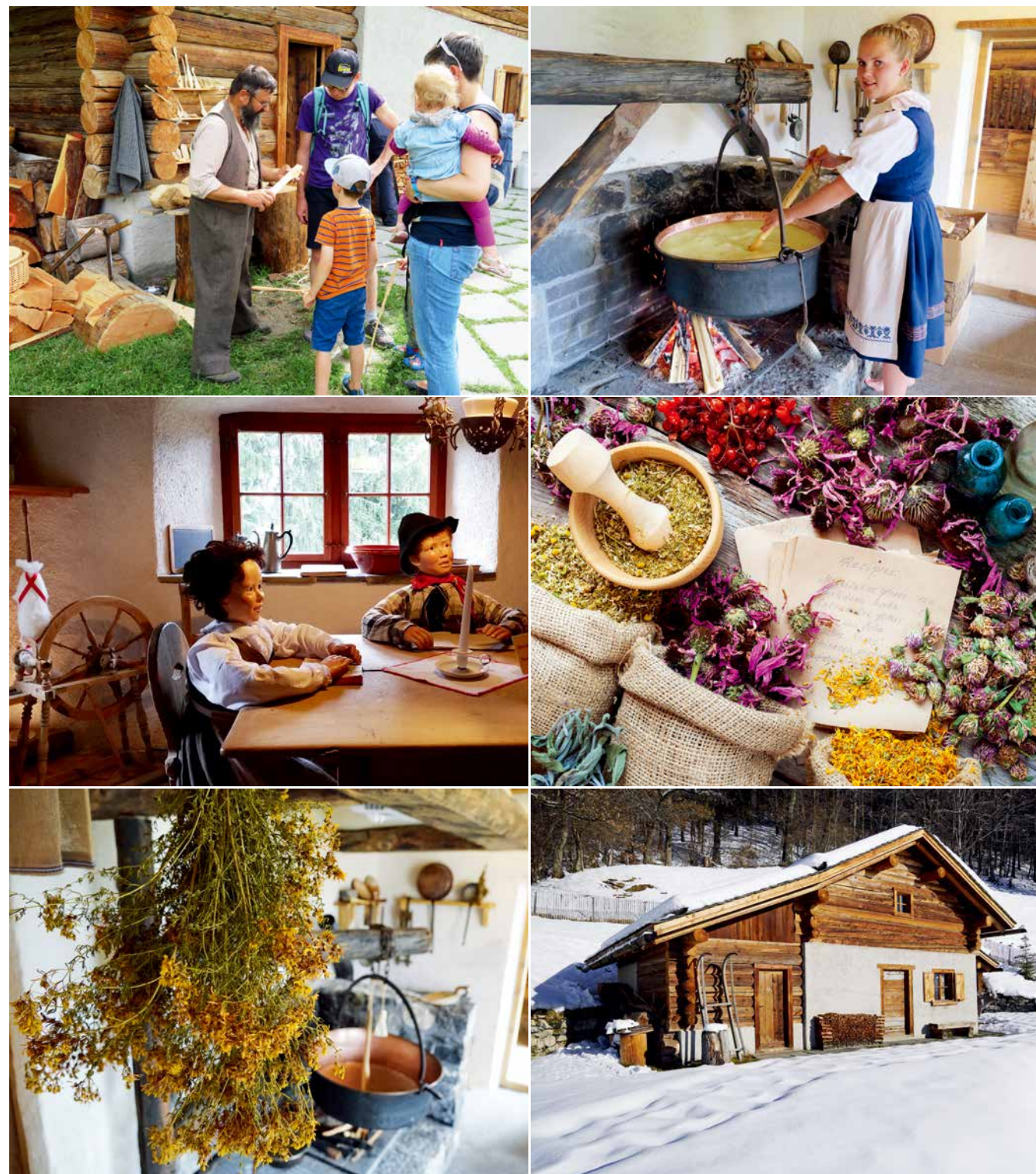
左上：遊客透過木雕體驗感受海蒂爺爺時代的生活方式。©Heididorf 左中：海蒂與彼得於屋內聊天的模樣。©Heididorf 左下：現場藉由每個細節展示當地傳統生活的日常。©Heididorf 右上：園區有提供遊客各種動手做的體驗。©Heididorf 右中：經由藥草認識阿爾卑斯山上人們經常運用的植物種類。©Heididorf 右下：雪地裡的傳統木屋呈現山中生活的另一種樣貌。©Heididorf

鎮上規劃了不同的健行參觀路線，沿途有清楚的指標，有些地點會加上解說牌及雕像，讓人能夠輕鬆自在地重溫書中場景，不僅有機會與動物巧遇，更能將阿爾卑斯山區靜謐怡人的自然風光盡收眼底。而為了可以同步貼近書中生活，當地推出各種體驗之旅，例如認識海蒂時代的藥草世界，了解如何運用草藥製作牙膏及止咳糖漿；透過雕刻及木頭搭建屋頂等方式，學習海蒂爺爺的傳統木工技藝；在山間小屋中，用傳統燒柴熬煮鐵鍋裡的牛奶，實做海蒂爺爺的奶酪；或是跟著海蒂、彼得一起到鄉村學校上課；還有動手製作如紡紗、竹籃及蕾絲編織等傳統工藝，使得原本存在於想像世界裡的童話故事，因而變得更加鮮明與真實。👉