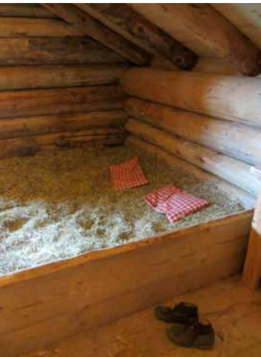
Slapen in het stro kan bij heel wat Zwitserse boeren.