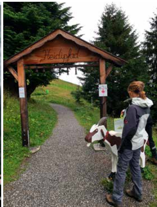
Start van het Heidipad.