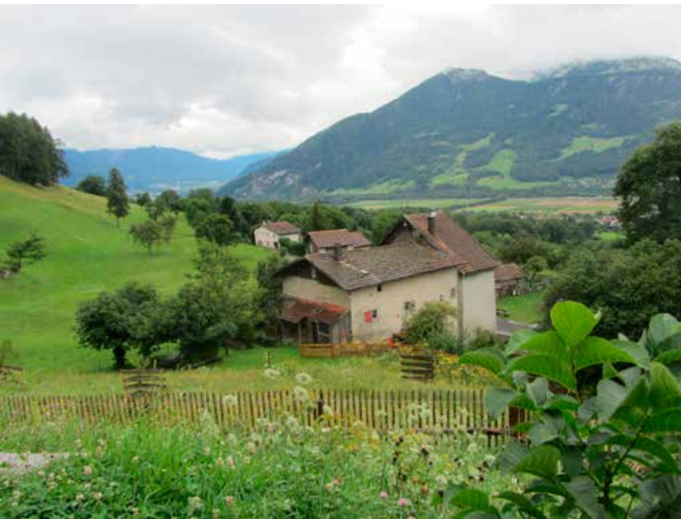
Heididorp in Maienfeld.