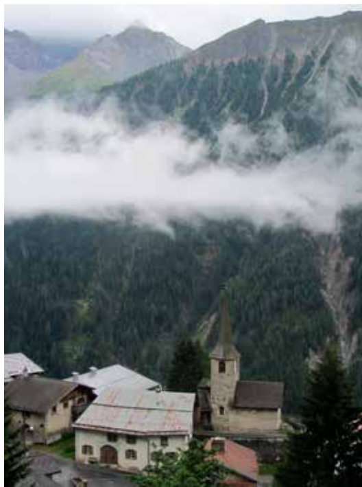
Adembenemend, ook bij slecht weer.